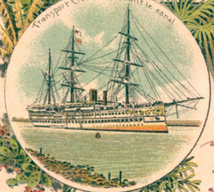
Transport Crocodile passant le canal